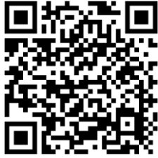
ขมื่นชัน