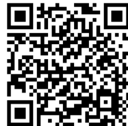
สระระแห่น